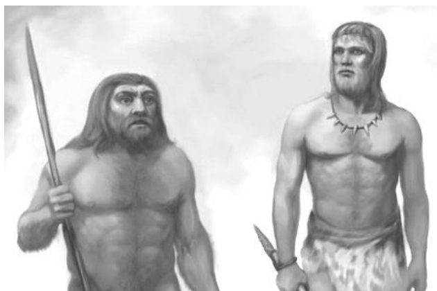
Рис. 1. Зовнішній вигляд неандертальця (ліворуч) та кроманьйонця (праворуч)

Довгий час представники "печерних людей", вважалися прямими предками сучасної людини, але як виявилось неандертальці – самостійний вид Homo sapiens . Така хибна думка виникла тому, що морфологія неандертальців була дуже схожою на кроманьйонців: вертикальне положення тіла, витягнуте обличчя, біпедальний спосіб пересування, великий череп, кругла потилиця, тощо. Але ж анатомія цих двох видів суттєво різнилася, неандертальці мали низький похилий лоб, великі надбрівні дуги, великий ніс, широкі плечові, ліктьові, кульшові та колінні суглоби, широкі грудну клітину і кістки тазу, короткі передпліччя і гомілки, гіпертрофовані м'язи тощо (рис. 1).