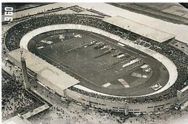
Рис. 4. Проект "Олімпійський стадіон в Амстердамі", категорія "Архітектура" ("Архітектурні проекти"), Амстердам, 1928 р.