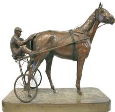
Рис. 2. "Американський рисак", категорія "Скульптура", Стокгольм, 1912 р.

Вернер Марх (Werner March) – відомий німецький архітектор, учасник Ігор XI Олімпіади 1936 року в Берліні, де в олімпійських конкурсах мистецтв завоював золоту медаль (номінація – "Містобудівні проекти") за проект "Олімпійський комплекс в Берліні" ("Reichssportfeld") (рис. 5) разом із братом Вальтером, а також срібну олімпійську медаль (номінація – "Архітектурні проекти") за архітектурний проект цього ж комплексу [4, 12].