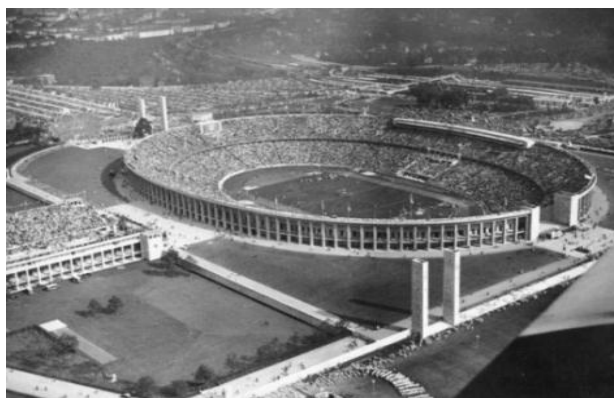
Рис. 5. Проект "Reichssportfeld", категорія "Архітектура" ("Містобудівні проекти", "Архітектурні проекти"), Берлін, 1936 р.