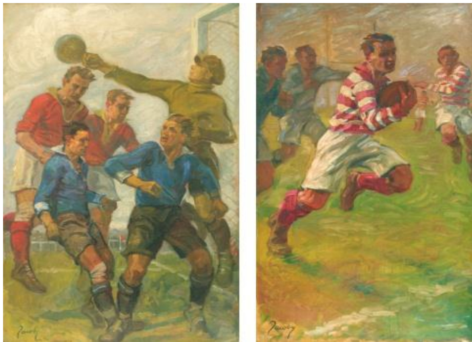
Рис. 1. Акварельні рисунки "Етюди про спорт" ("Rugby", "Corner"), категорія "Живопис", Париж, 1924 р.

Як свідчать джерела, в олімпійських конкурсах мистецтв змагалися не тільки діячі мистецтва, але й спортсмени. В історії Олімпійських ігор два учасники були призерами як спортивних, так і художніх змагань. Уолтер Уайненс (Walter Winans) – американський стрілець й скульптор, який виборов звання першого олімпійського чемпіона в конкурсі мистецтв у категорії "Скульптура". Альфред Хайош (Alfréd Hajós) – угорський плавець й архітектор, який став призером у категорії "Архітектура" [4, 14].