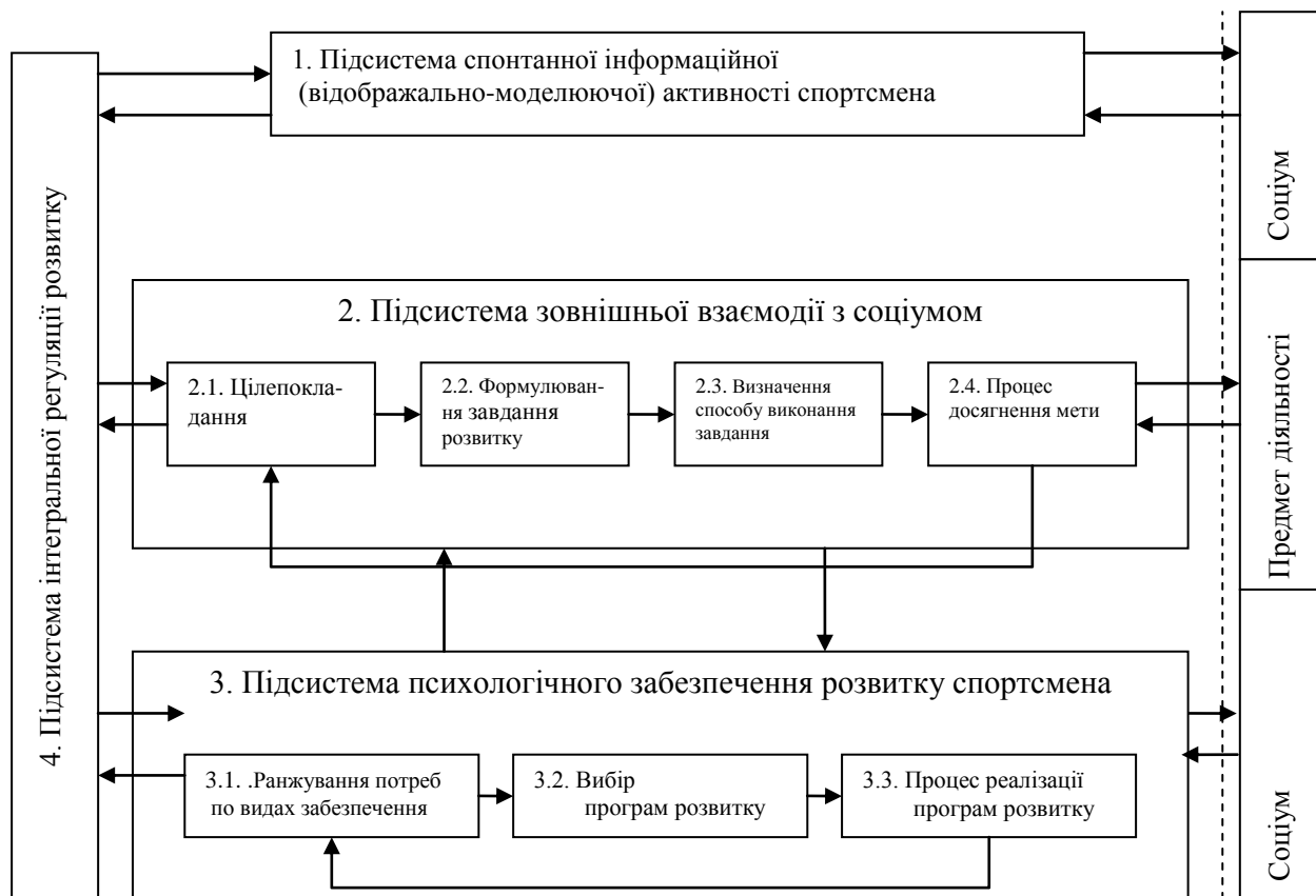
Рис. 1. Структурна модель розвитку СТСД спортсмена

Ранжування потреб, вибір програм розвитку та процес їх реалізації на різних стадіях фізичної реабілітації. Дослідження потреб розвитку психологічних особливостей системи діяльності спортсменів, психологічних факторів розвитку системи діяльності відбувалось з виходом на організаційні рішення з розвитку процесу та засобів діяльності та формування необхідного рівня роботоздатності спортсменів.