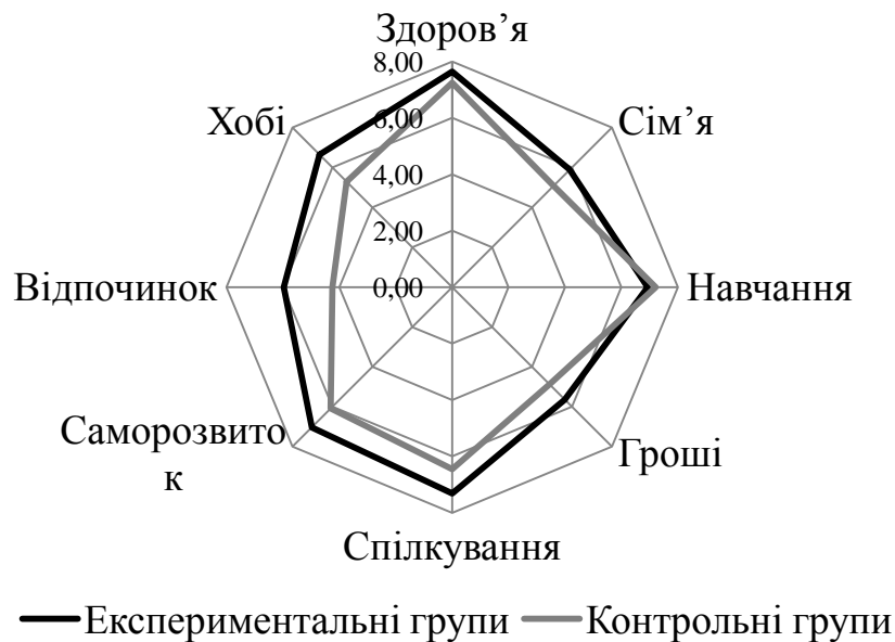
Рис. 1. Середні показники зони професійного комфорту в експериментальних і контрольних групах

контрольних груп вимушені приділяти навчанню більше уваги і часу за рахунок жертвування іншими параметрами (особливо відпочинком, хобі і саморозвитком).