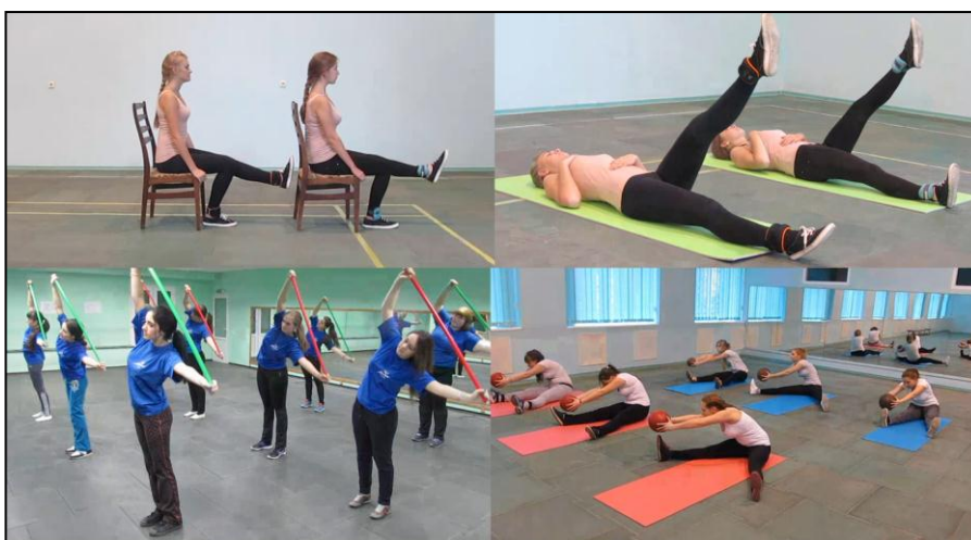
Рис. 1. Кадры видео уроков по физической реабилитации

Студентам группы реабилитации были предложены видео уроки по методам развития физических качеств, где раскрываются термины и понятия физических качеств человека, излагаются особенности обучения двигательным действиям в группе физической реабилитации. Кроме теории в пособии даны фото упражнений и видео комплексов специальных заданий, а также подвижных игр, выполняемые студентами группы физической реабилитации нашего вуза. Все средства для развития физических качеств подобраны для студентов с различными заболеваниями, где особое внимание уделяется исходному положению, правильному выполнению упражнений и дыханию (рис. 1).