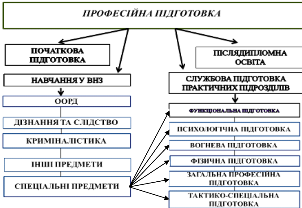
Рис. 1. Професійна підготовка в правоохоронних органах України на протязі навчання

Виклад основного матеріалу дослідження. Моделювання – це процес побудови, вивчення та використання моделей для визначення, уточнення і оптимізації будь-якого процесу. Моделювання може містити в собі декілька моделей. Модель використовується в якості заміни об'єкту управління з тим, щоб отримати нові дані про об'єкт, вивчити його функціональні характеристики тощо. На (рис. 1) показана загальна модель підготовки майбутніх працівників правоохоронних органів.