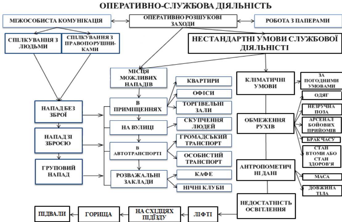
Рис. 2. Варіанти виконання покладених обов'язків на працівників правоохоронних органів під час несення служби

Екстремальні ситуації, як правило, активізують інстинкт самозбереження, захисну функцію та приводять працівника в стан розумової активізації мислення на прийняття правильної реакції дії на відповідь. Якщо він психологічно та фізично не готовий до цього, то може мати місце індивідуальні негативні реакції: пустота перед очима; часткова глухота; відмова моторних функцій; підвищений стрес; раптовий шок; втрата відчуття часу.