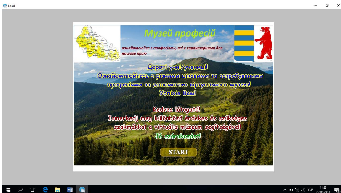
Мал. 1. Початок роботи віртуального музею "Музей професій"

Для успішної профорієнтаційної роботи з метою розвитку інформування учнів про різні види професійної діяльності та розвитку професійних інтересів юнаків та дівчат нами був створений віртуальний музейний центр під назвою "Музей професій" (див. мал. 1; мал. 2).