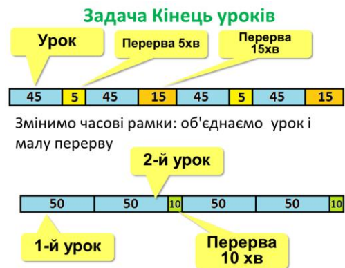
Рисунок 2. Спрощення моделі