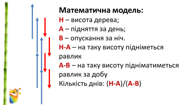
Рис. 7. Модель задачі

Як бачимо, за добу равлик піднімається на (a - b) метрів. Піднімаючись у якийсь із днів на a метрів, він досягне потрібної висоти h . Відповідно, равлик повинен пройти не менше, ніж (h - a) метрів, щоб наступного дня завершити процес підйому. Тому легко визначити кількість днів, коли він досягне висоти принаймні (h - a) метрів. Це буде значення, яке рівне