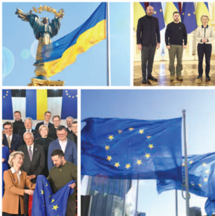
Рис. 1. Фотоколаж «Stand with Ukraine» (створено здобувачем освіти 11 класу Чернігівського обласного наукового ліцею; 2022 р.; «Історія України»)

8. Створення власного відео (наприклад, для соцмереж), фотоколажу тощо. Наприклад, завдання скласти фотоколаж при виконанні практичної роботи «Stand with Ukraine. Міжнародна підтримка України у боротьбі проти агресії Росії» (рис. 1).