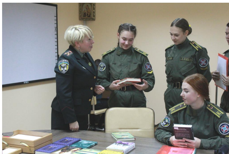
Фото 10. Книжкові подарунки для учасників круглого столу «Знати. Дбати. Пам'ятати» (жовтень 2021 р.)

У травні 2024 р. у контексті зустрічі з директором Centropa в Пенітенціарній академії України відбувся круглий стіл «Вивчення історії трагедії Голокосту в ПАУ: актуальність, можливості та виклики» (фото 11).