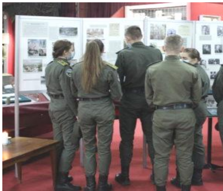
Фото 2. Курсанти академії на виставці «У житті та смерті вони назавжди з нами... Тліном не взялось» у Чернігівському обласному історичному музеї імені В. В. Тарновського

В контексті даної теми має місце співпраця з Чернігівським обласним історичним музеєм імені В.В.Тарновського. Зокрема, у вересні 2021 р. курсанти взяли участь у відкритті виставки «У житті та смерті вони назавжди з нами... Тліном не взялось» у Чернігівському обласному історичному музеї імені В. В. Тарновського ( фото 2-3 ).