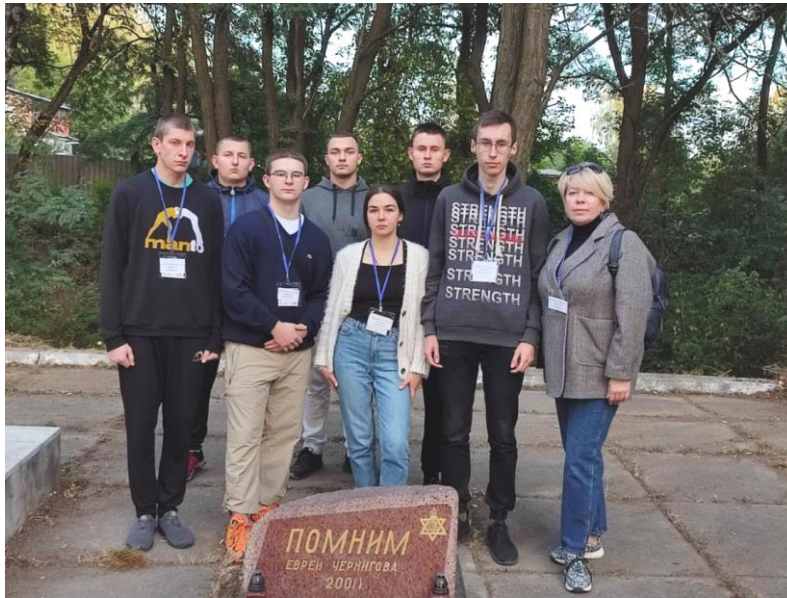
Фото 1. Курсанти Пенітенціарної академії вшанували меморіал загиблих євреїв Чернігова у 1941-1943 рр. в урочищі Березовий Рів

Разом з європейською спільнотою курсанти і студенти Пенітенціарної академії України вшановують пам'ятні дні, зокрема, 29-30 вересня – День пам'яті жертв Бабиного Яру, 27 вересня – Міжнародний день пам'яті жертв Голокосту, 14 травня – День пам'яті українців, які рятували євреїв під час Другої світової війни. У ці дні спільно з громадою Чернігова вони беруть участь у меморіальних заходах з вшанування розстріляних нацистами в урочищі Березовий рів жителів Чернігова – євреїв та пацієнтів психоневрологічної лікарні ( фото 1 ).