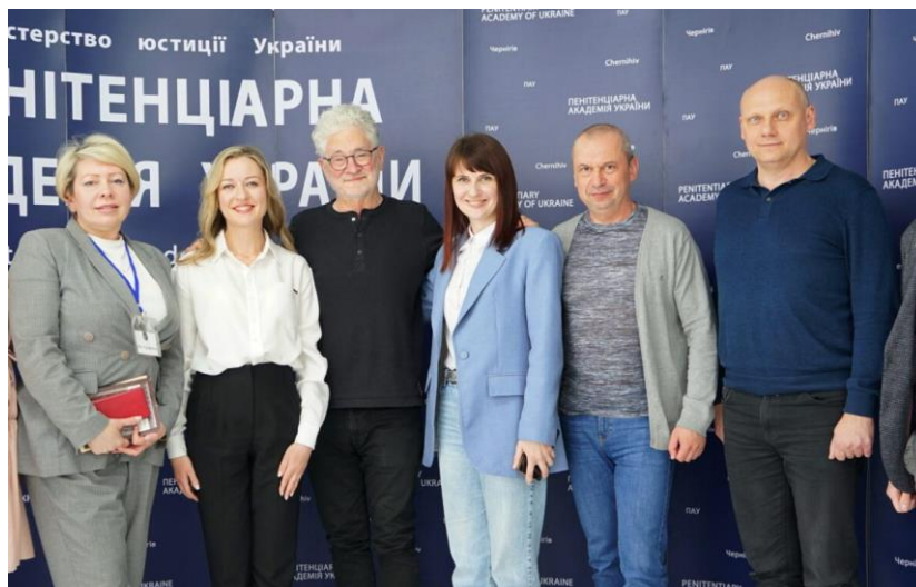
Фото 11. Зустріч з Едвардом Серротою в Пенітенціарній академії України (1-2 травня 2024 р.)

Для творчого зображення цінності демократичних процесів, зв'язку минулого і сьогодення, розуміння важливості вивчення уроків історії була випробована методика створення колажів з історичних і особистих фотографій, яку викладачі засвоїли на одному з семінарів «Сентгора».