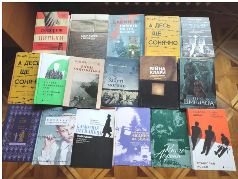
Фото 9. Виставка нових видань, присвячених історії Голокосту в науковій бібліотеці Пенітенціарної академії України