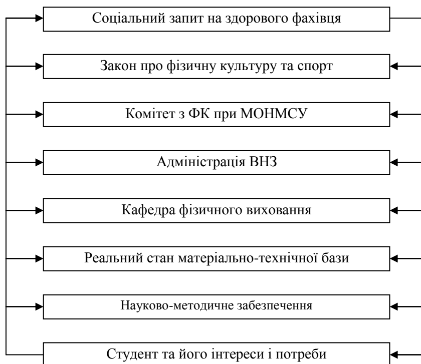
Рис. 1. Модель формування передумов організаційно-методичного забезпечення системи фізичного виховання студентів ВНЗ України

Соціальний запит на фахівця з високим рівнем фізичної працездатності та професійно важливих психофізіологічних здібностей існує на даному етапі в багатьох галузях, однак в умовах абсолютної реалізації інтересів і потреб студентів досягти цього рівню неможливо так як переважну кількість молоді у відповідному віці приваблюють, наприклад спортивні ігри – футбол, баскетбол, волейбол та ін., засоби яких не забезпечують розвиток загальної витривалості у необхідних обсягах, не піддаються контролю рухової діяльності, сприяють перенапруженню функцій опорно-рухового апарату та серцево-судинної системи. Крім того, така кількість ігрових залів і "викладачів-ігровиків" може бути не передбачена навіть у тих ВНЗ, де здійснюють підготовку фахівців галузі фізичної культури.